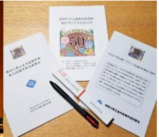
式典の舞台の様子と、式典と祝賀会のパンフレット、記念品の校名入りボールペン

創立50周年記念式典は、2025年10月30日、鎌倉芸術館・大ホールで開催されました。全校生徒・職員・PTA役員、来賓として招待された歴代校長をはじめとする旧職員、県内高等学校の校長・PTA会長、学校運営協議会委員等の近隣関係者など、1,100名を超える出席者となったこの日は、同窓会役員も全員が出席し、第1部を記念式典、第2部を記念音楽会としておこなわれました。