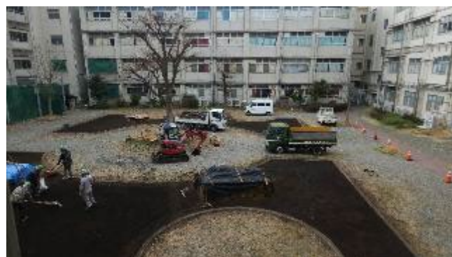
中庭整備工事の様子(2026年3月)

※クラウドファンディングに関して詳しくは次のリンクから、寄付者向けの報告書がご覧いただけます。